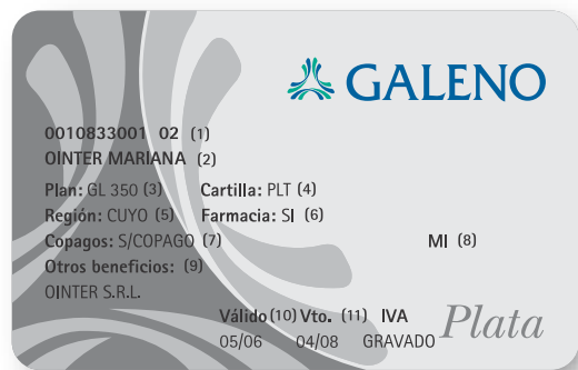
Credencial vigente para socios GALENO Plata