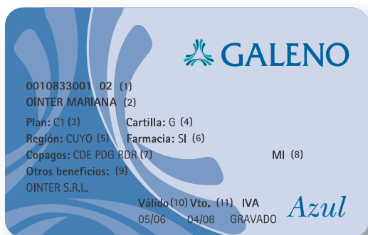
Credencial vigente para socios GALENO Azul