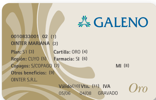
Credencial vigente para socios GALENO Oro